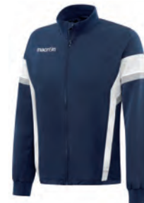
81190701 NAVY/BIANCO NAVY/WHITE