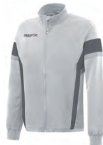
81190128 BIANCO/ANTRACITE WHITE/ GUN METAL