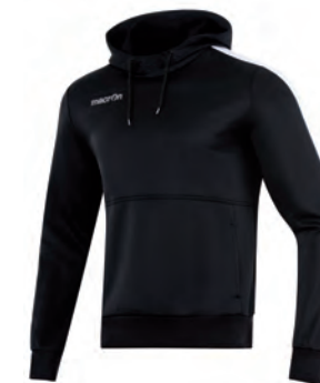
911509 NERO/BIANCO BLACK/WHITE