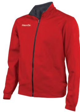
81100228 ROSSO/ANTRACITE RED/GUN METAL