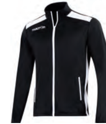
81450901 NERO/BIANCO BLACK/WHITE