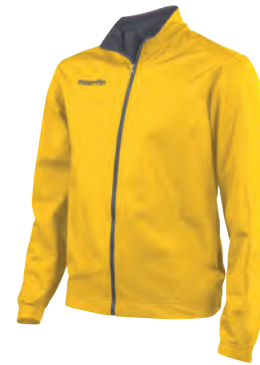
81100528 GIALLO/ANTRACITE YELLOW/GUN METAL