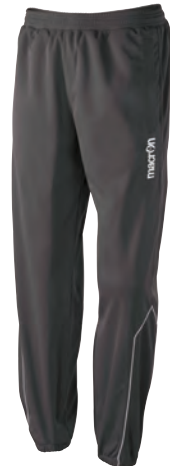
82132801 ANTRACITE/BIANCO GUN METAL/WHITE