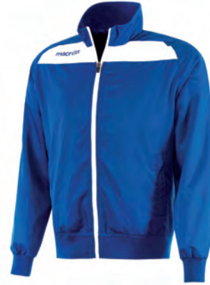
81160301 AZZURRO/BIANCO BLUE/WHITE