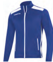
81450301 ROYAL/BIANCO ROYAL/WHITE