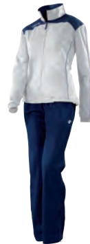
81250701 NAVY/BIANCO NAVY/WHITE