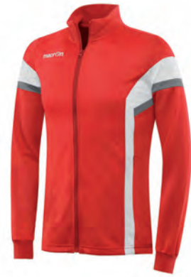
81200201 ROSSO/BIANCO RED/WHITE