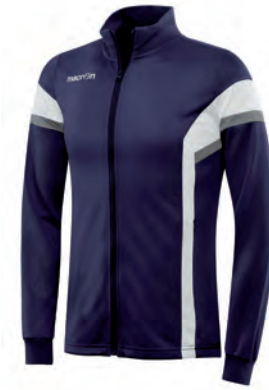
81200701 NAVY/BIANCO NAVY/WHITE