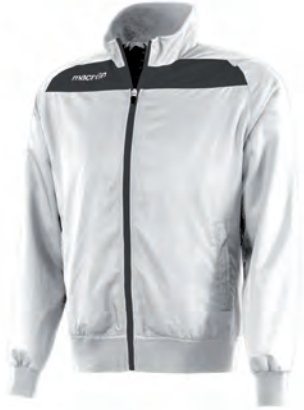
81160128 BIANCO/ANTRACITE WHITE/GUN METAL