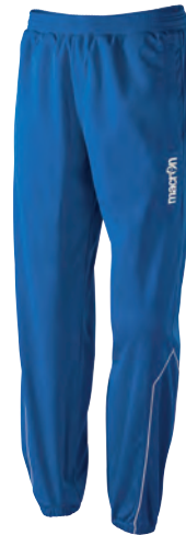
82130301 AZZURRO/BIANCO BLUE/WHITE