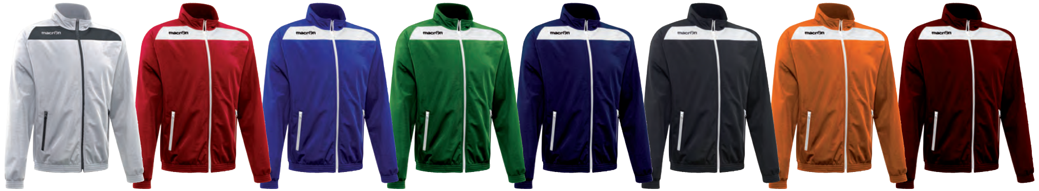
81170128 BIANCO/ANTRACITE WHITE/GUN METAL