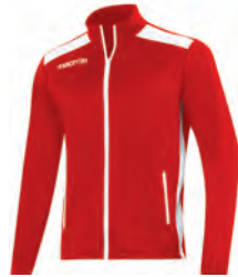
81450201 ROSSO/BIANCO RED/WHITE