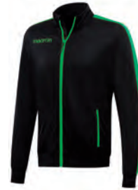
81470904 NERO/VERDE BLACK/GREEN