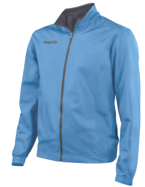
81101028 CELESTE/ANTRACITE COLUMBIA/GUN METAL