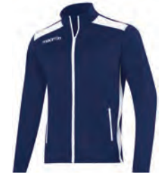
81450701 NAVY/BIANCO NAVY/WHITE