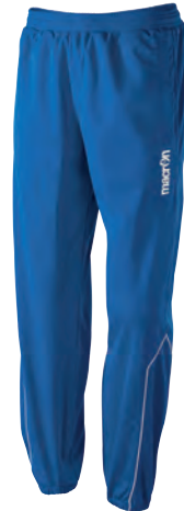
82130301 AZZURRO/BIANCO BLUE/WHITE