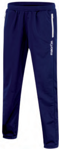
82170701 NAVY/BIANCO NAVY/WHITE