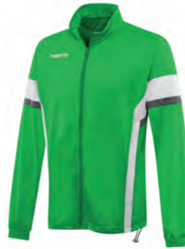
81180401 VERDE/BIANCO GREEN/WHITE