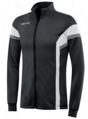
81200901 NERO/BIANCO BLACK/WHITE