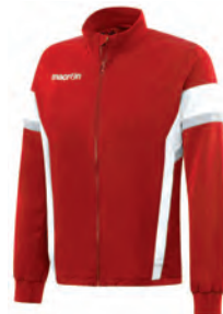
81190201 ROSSO/BIANCO RED/WHITE