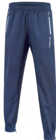
82160701 NAVY/BIANCO NAVY/WHITE