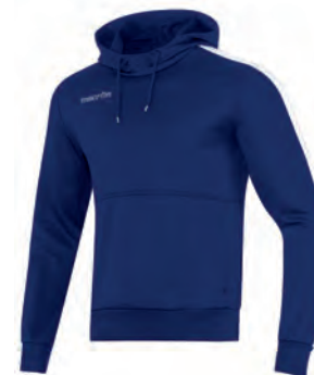
911507 NAVY/BIANCO NAVY/WHITE