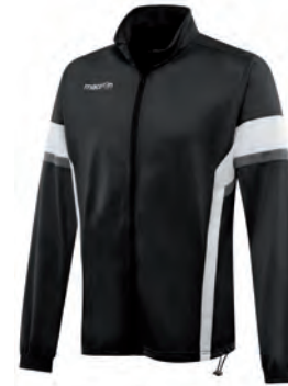
81180901 NERO/BIANCO BLACK/WHITE