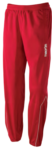
82130201 ROSSO/BIANCO RED/WHITE