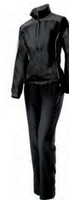
56480928 NERO/ANTRACITE/GRIGIO BLACK/GUN METAL/GREY