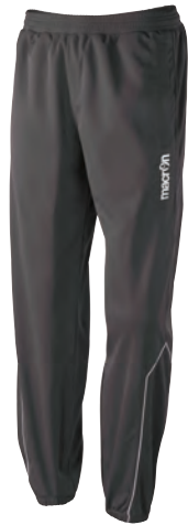
82132801 ANTRACITE/BIANCO GUN METAL/WHITE