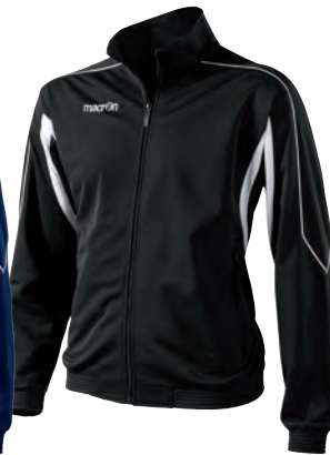
81130901 NERO/BIANCO BLACK/WHITE