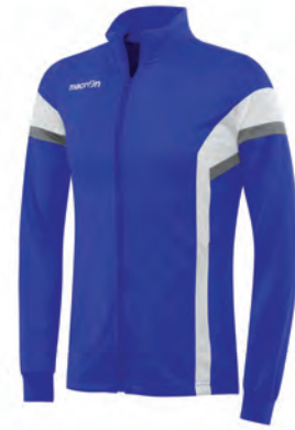
81200301 AZZURRO/BIANCO BLUE/WHITE