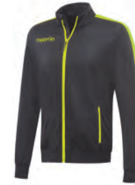
81472815 ANTRACITE/GIALLO FLUO GUN METAL/NEON YELLOW