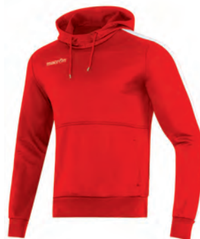
911502 ROSSO/BIANCO RED/WHITE