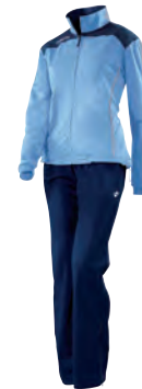
81250710 NAVY/CELESTE NAVY/COLUMBIA