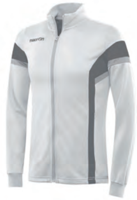
81200128 BIANCO/ANTRACITE WHITE/ GUN METAL