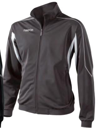
81132801 ANTRACITE/BIANCO GUN METAL/WHITE