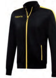
81470905 NERO/GIALLO BLACK/YELLOW