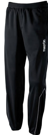
82130901 NERO/BIANCO BLACK/WHITE