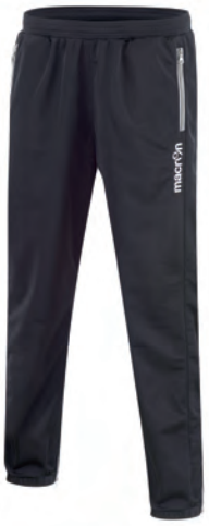
82170901 NERO/BIANCO BLACK/WHITE