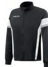
81190901 NERO/BIANCO BLACK/WHITE