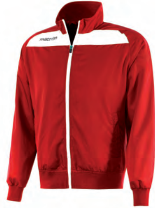
81160201 ROSSO/BIANCO RED/WHITE