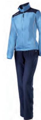
56480710 NAVY/CELESTE NAVY/COLUMBIA