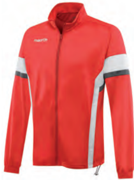
81180201 ROSSO/BIANCO RED/WHITE