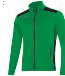
81450409 VERDE/NERO GREEN/BLACK