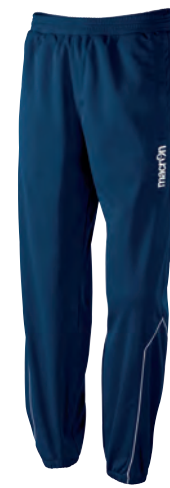
82130701 NAVY/BIANCO NAVY/WHITE