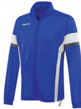
81180301 AZZURRO/BIANCO BLUE/WHITE