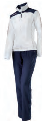
56480701 NAVY/BIANCO/GRIGIO NAVY/WHITE/GREY