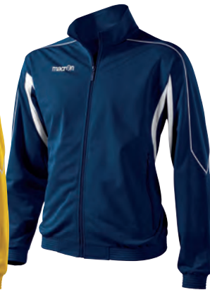
81130701 NAVY/BIANCO NAVY/WHITE