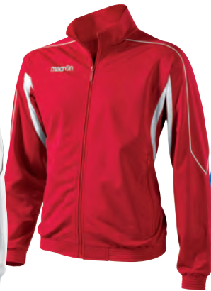
81130201 ROSSO/BIANCO RED/WHITE