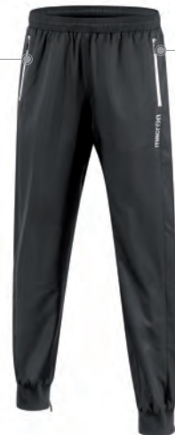
82160901 NERO/BIANCO BLACK/WHITE

Fodera interna in mesh Mesh interior lining