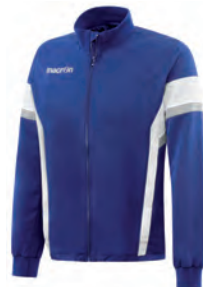
81190301 AZZURRO/BIANCO BLUE/WHITE