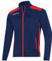
81450702 NAVY/ROSSO NAVY/RED