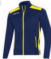
81450705 NAVY/GIALLO NAVY/YELLOW