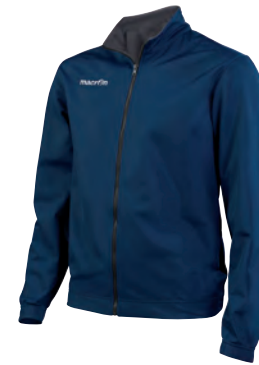
81100728 NAVY/ANTRACITE NAVY/GUN METAL