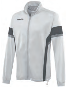
81180128 BIANCO/ANTRACITE WHITE/ GUN METAL