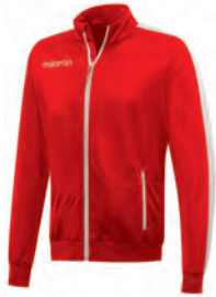
81470201 ROSSO/BIANCO RED/WHITE