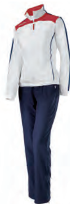
56480201 ROSSO/BIANCO/NAVY RED/WHITE/NAVY

PREZZO/PRICE SR: RRP 50,30 £ JR: RRP 41,90 £