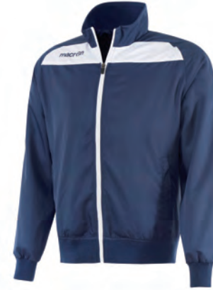
81160701 NAVY/BIANCO NAVY/WHITE