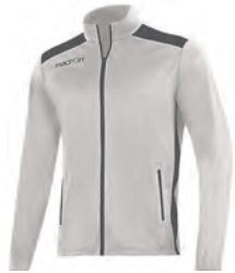
81450128 BIANCO/ANTRACITE WHITE/GUN METAL