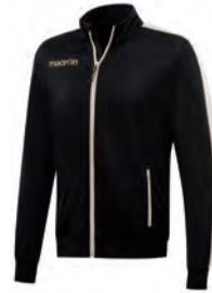
81470901 NERO/BIANCO BLACK/WHITE