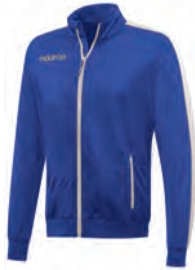
81470301 AZZURRO/BIANCO BLUE/WHITE