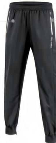
82160901 NERO/BIANCO BLACK/WHITE

Fodera interna in mesh Mesh interior lining