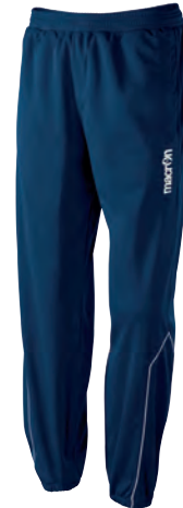
82130701 NAVY/BIANCO NAVY/WHITE