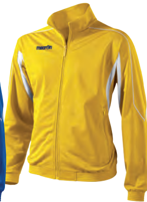
81130501 GIALLO/BIANCO YELLOW/WHITE