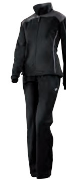
81250928 NERO/ANTRACITE BLACK/GUN METAL