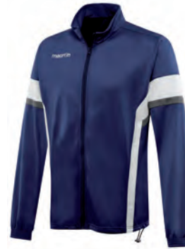
81180701 NAVY/BIANCO NAVY/WHITE