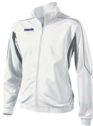
81130128 BIANCO/ANTRACITE WHITE/GUN METAL