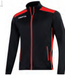
81450902 NERO/ROSSO BLACK/RED