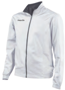
81100128 BIANCO/ANTRACITE WHITE/GUN METAL