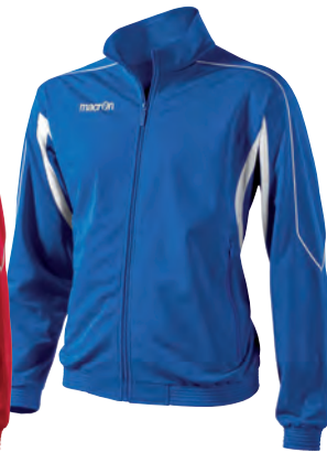
81130301 AZZURRO/BIANCO BLUE/WHITE