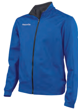
81100328 AZZURRO/ANTRACITE BLUE/GUN METAL