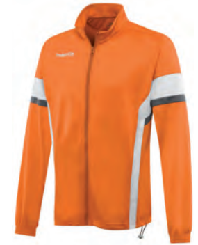
81181301 ARANCIO/BIANCO ORANGE/WHITE