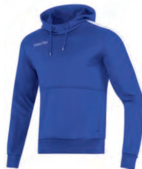
911503 ROYAL/BIANCO ROYAL/WHITE