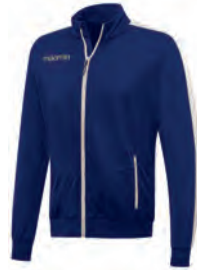
81470701 NAVY/BIANCO NAVY/WHITE