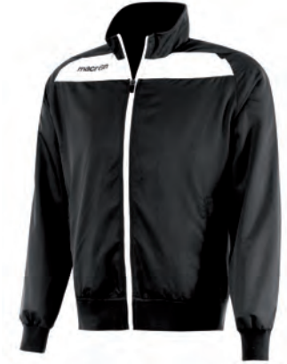
81160901 NERO/BIANCO BLACK/WHITE