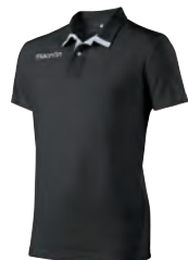
90180901 NERO/BIANCO BLACK/WHITE