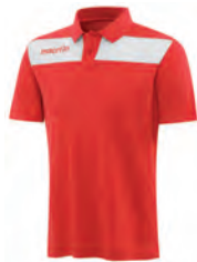
90490201 ROSSO/BIANCO RED/WHITE