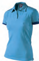
90201007 CELESTE/NAVY COLUMBIA/NAVY