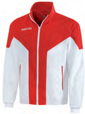
81110102 BIANCO/ROSSO WHITE/RED