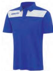
90490301 AZZURRO/BIANCO BLUE/WHITE