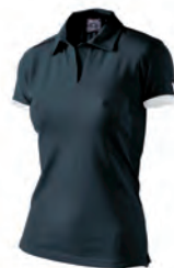
90200901 NERO/BIANCO BLACK/WHITE