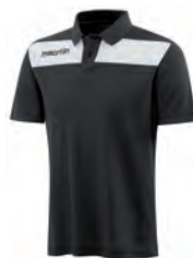
90490901 NERO/BIANCO BLACK/WHITE