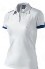
90200107 BIANCO/NAVY WHITE/NAVY

PREZZO/PRICE SR: RRP 18,60 £ JR: RRP 15,50 £