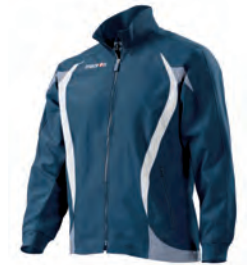
81000701 NAVY/BIANCO NAVY/WHITE