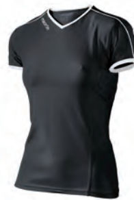
90210901 NERO/BIANCO BLACK/WHITE