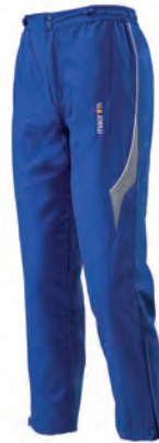
82000301 AZZURRO/BIANCO BLUE/WHITE