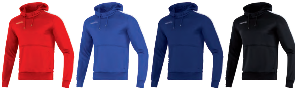
911502 ROSSO/BIANCO RED/WHITE

PREZZO/PRICE SR: RRP 35,90 £ JR: RRP 29,90 £