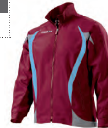
81001410 GRANATA/CELESTE CARDINAL/COLUMBIA