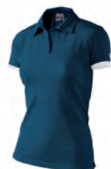
90200701 NAVY/BIANCO NAVY/WHITE