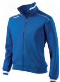
91080301 AZZURRO/BIANCO BLUE/WHITE