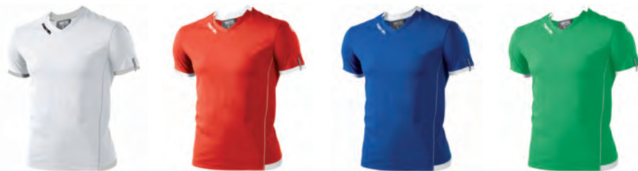
90380119 BIANCO/GRIGIO WHITE/GREY

PREZZO/PRICE SR: RRP 13,60 £ JR: RRP 11,30 £