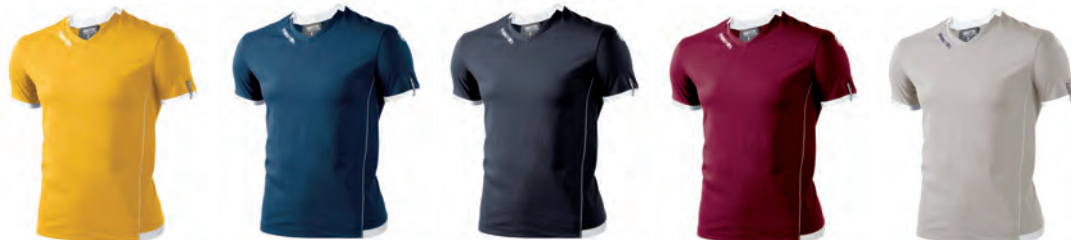
90380501 GIALLO/BIANCO YELLOW/WHITE

PREZZO/PRICE SR: RRP 17,05 £ JR: RRP 14,20 £