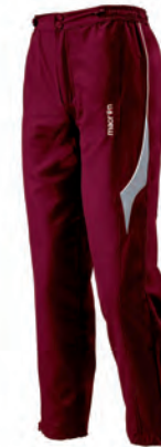
82001401 GRANATA/BIANCO CARDINAL/WHITE