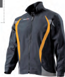
81000913 NERO/ARANCIO BLACK/ORANGE