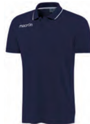
90220701 NAVY/BIANCO NAVY/WHITE