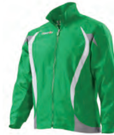
81000401 VERDE/BIANCO GREEN/WHITE