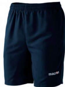
529098 NAVY SCURO/DARK NAVY