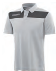
90490128 BIANCO/ANTRACITE WHITE/GUN METAL