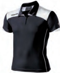
90430901 NERO/BIANCO BLACK/WHITE