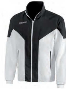
81110109 BIANCO/NERO WHITE/BLACK