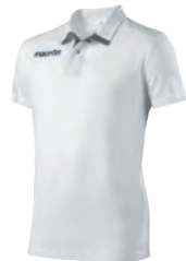
90180119 BIANCO/GRIGIO WHITE/GREY

PREZZO/PRICE SR: RRP 19,45 £ JR: RRP 16,20 £