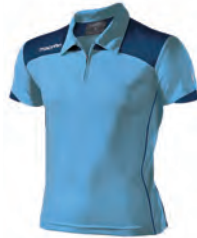
90431007 CELESTE/NAVY COLUMBIA/NAVY