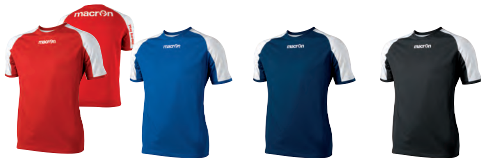
90370201 ROSSO/BIANCO RED/WHITE