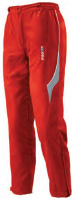
82000201 ROSSO/BIANCO RED/WHITE