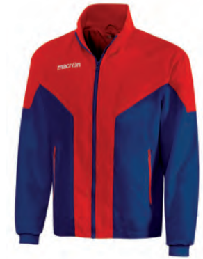
81110702 NAVY/ROSSO NAVY/RED