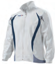
81000107 BIANCO/NAVY WHITE/NAVY