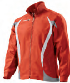
81000201 ROSSO/BIANCO RED/WHITE