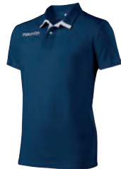
90180701 NAVY/BIANCO NAVY/WHITE