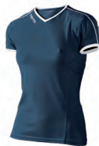
90210207 NAVY/BIANCO NAVY/WHITE