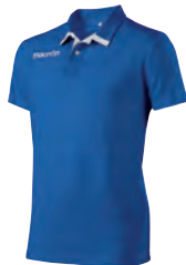
90180301 AZZURRO/BIANCO BLUE/WHITE