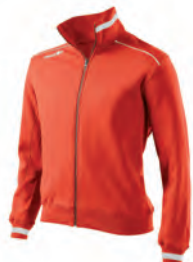
91080219 ROSSO/GRIGIO RED/GREY