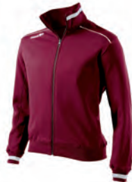
91081419 GRANATA/GRIGIO CARDINAL/GREY