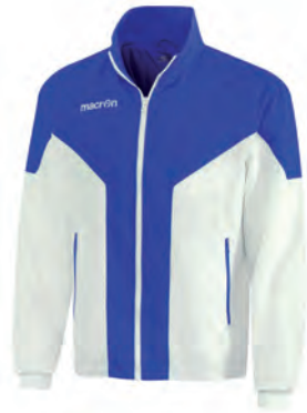
81110103 BIANCO/AZZURRO WHITE/BLUE