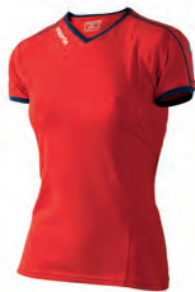
90210701 ROSSO/NAVY RED/NAVY