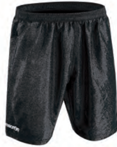
529309 NERO/ BLACK