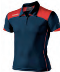
90430702 NAVY/ROSSO NAVY/RED