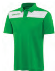
90490401 VERDE/BIANCO GREEN/WHITE