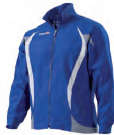
81000301 AZZURRO/BIANCO BLUE/WHITE