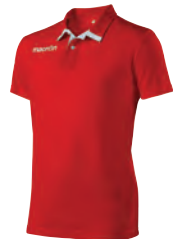
90180201 ROSSO/BIANCO RED/WHITE