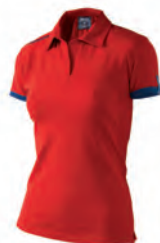
90200207 ROSSO/NAVY RED/NAVY