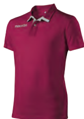
90181401 GRANATA/BIANCO CARDINAL/WHITE