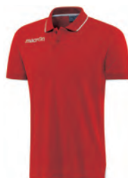
90220201 ROSSO/BIANCO RED/WHITE