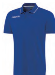
90220301 AZZURRO/BIANCO BLUE/WHITE