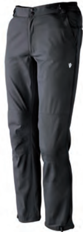
922128 ANTRACITE/GUN METAL