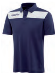
90490701 NAVY/BIANCO NAVY/WHITE