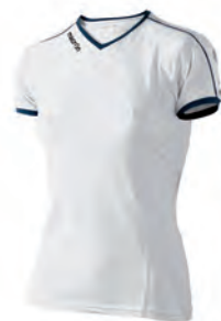
90210107 BIANCO/NAVY WHITE/NAVY