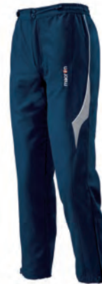
82000701 NAVY/BIANCO NAVY/WHITE