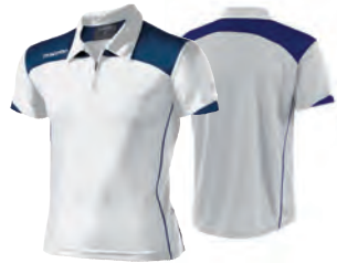
90430107 BIANCO/NAVY WHITE/NAVY