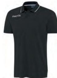
90220901 NERO/BIANCO BLACK/WHITE