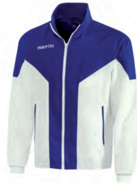
81110107 BIANCO/NAVY WHITE/NAVY