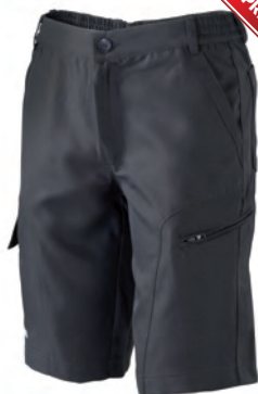
920619 ANTRACITE/GUN METAL