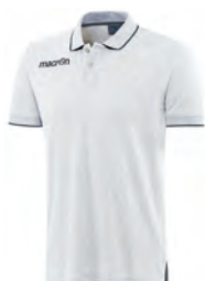
90220128 BIANCO/ANTRACITE WHITE/GUN METAL

PREZZO/PRICE SR: RRP 21,50 £ JR: RRP 17,90 £