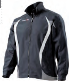
81000901 NERO/BIANCO BLACK/WHITE