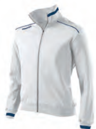
91080107 BIANCO/NAVY WHITE/NAVY

PREZZO/PRICE SR: RRP 43,10 £ JR: RRP 35,90 £