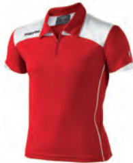
90430201 ROSSO/BIANCO RED/WHITE