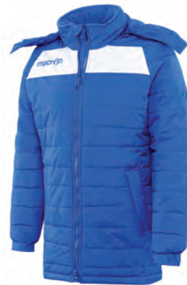
91310301 AZZURRO/BIANCO BLUE/WHITE