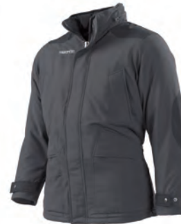
933028 ANTRACITE/GUN METAL