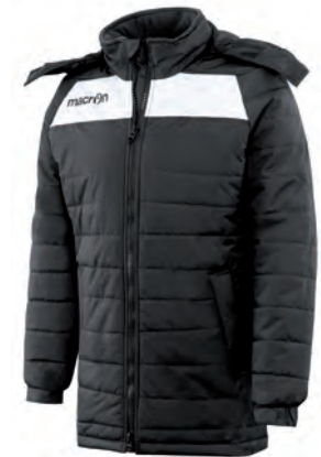
91310901 NERO/BIANCO BLACK/WHITE