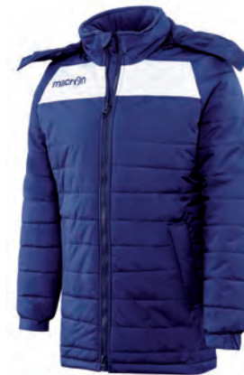
91310701 NAVY/BIANCO NAVY/WHITE