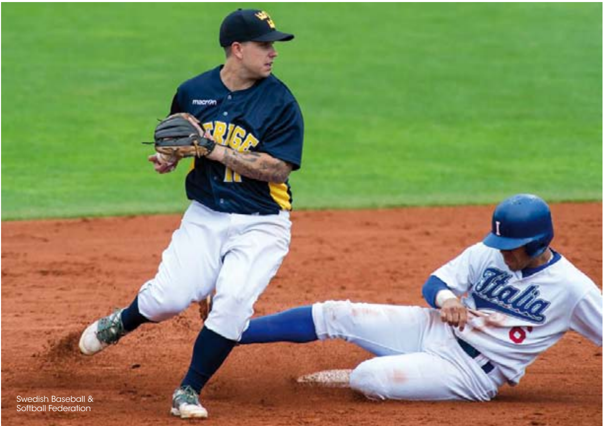
Swedish Baseball & Softball Federation