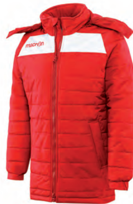
91310201 ROSSO/BIANCO RED/WHITE

Polso elasticizzato con chiusura in velcro Elastic wrist with velcro closure