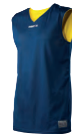
40200705 NAVY/GIALLO NAVY/YELLOW