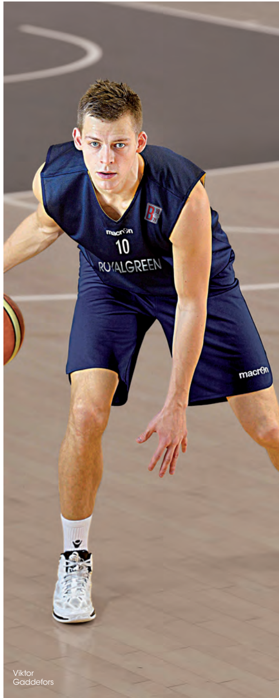
Maglia reversibile Reversible jersey

ABBINAMENTO CONSIGLIATO/SUGGESTED PANT COMBINATION OXIDE SHORT