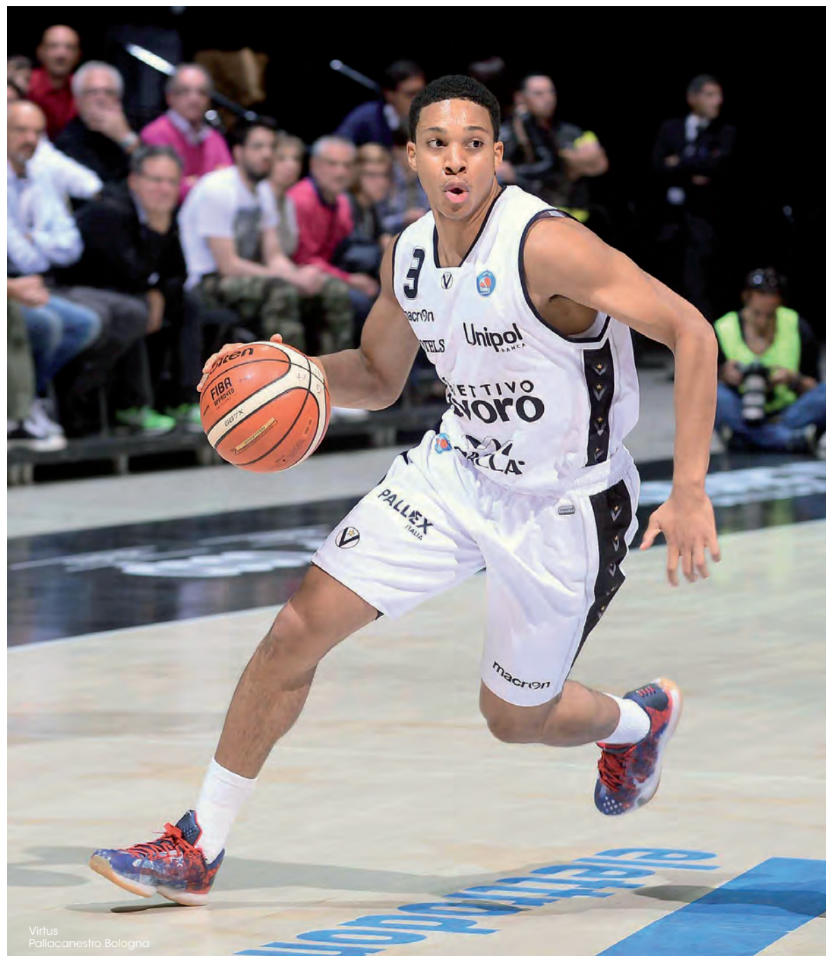
Virtus Pallacanestro Bologna