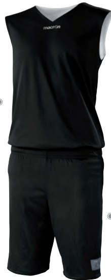
Short reversibile Reversible short