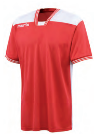
901902 ROSSO/BIANCO RED/WHITE