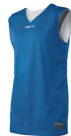
40200301 AZZURRO/BIANCO BLUE/WHITE