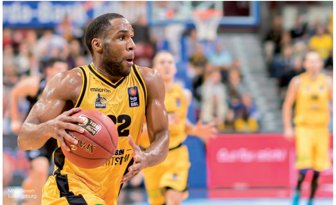
Mhlr Riesen Ludwigsburg