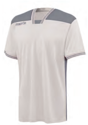
901901 BIANCO/GRIGIO WHITE/GREY

PREZZO/PRICE SR: RRP 23,80 € JR: RRP 19,80 €