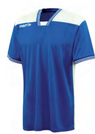
901903 ROYAL/BIANCO ROYAL/WHITE